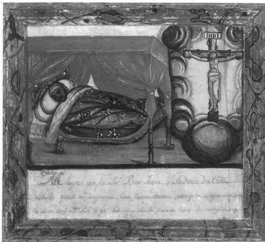
Figura 2: Extraída de CASTRO, Maria de Moura. Ex-votos mineiros: as tábuas votivas do ciclo do ouro . Rio de Janeiro: Expressão e cultura, 1994

Conforme foi possível constatar em pesquisa mais ampla, ex-votos pintados de diversas regiões apresentam similaridades nas formas de composição das imagens. Apesar de algumas diferenças formais, é possível falar de um certo padrão de representação dos ex-votos pintados. Confeccionadas por artífices anônimos, provavelmente ligados à produção artística em Minas, os pintores de tábuas votivas aderiam a uma tradição informal reproduzindo formas de representação já consagradas pelo costume. (ABREU, 2001, p. 39-42)