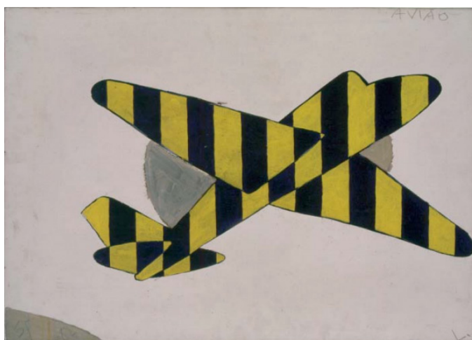
Figura 2 - obra Aviões , 1982