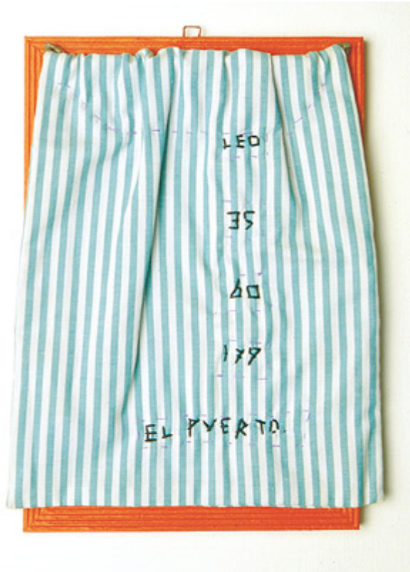
Figura 5 - El Puerto , 1992