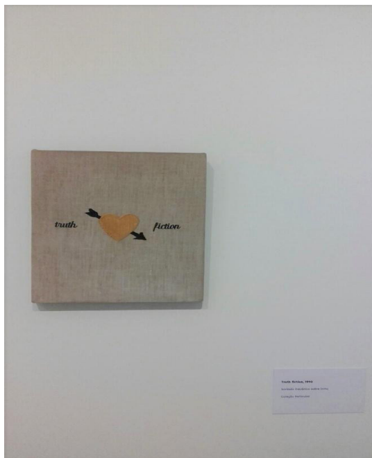
Figura 6 - fotografia da obra Truth Fiction , 1990, da exposição “Leonilson: arquivo e memória vivos”