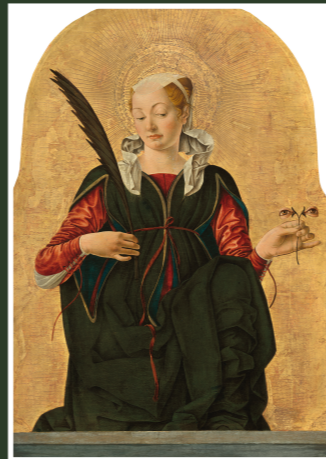
Francesco del Cosso. Santa Luzia (c. 1473-1474). Tempera s/ painel de álamo. National Gallery of Art, Washington, EUA